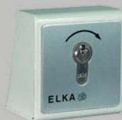
Profil-Zylinderschloss am Auflagepfosten (optional)