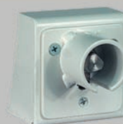
Feuerwehr-Dreikant am Auflagepfosten (optional)