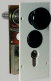
Verriegelung 1 und 2* Profil-Zylinderschloss am Schrankenständer (optional)