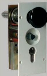
Verriegelung 3 und 4* Feuerwehr-Dreikant und Profil-Zylinderschloss am Schrankenständer (optional)